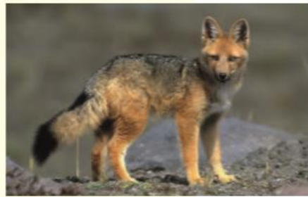
▲ Zorro culpeo en la cordillera de los Andes.

Hábitat: Vive en cualquier lugar donde pueda hacer sus madrigueras, matorrales, márgenes de arroyos y comunidades arbustivas bajas y densas, principalmente de ñirre .